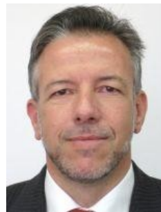
Pascal Décosterd, Schweiz. Generalkonsul Barcelona