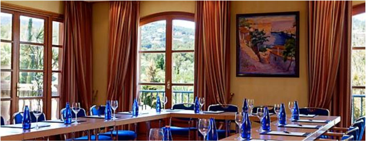
Konferenzraum des Arabella Hotels.